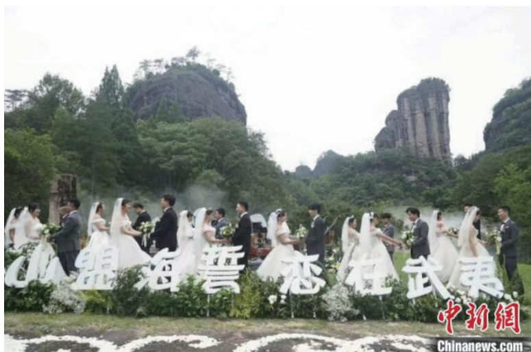
5月20日，“山盟海誓·恋在武夷”主题文旅产品推广系列活动在武夷山玉女峰前举办。