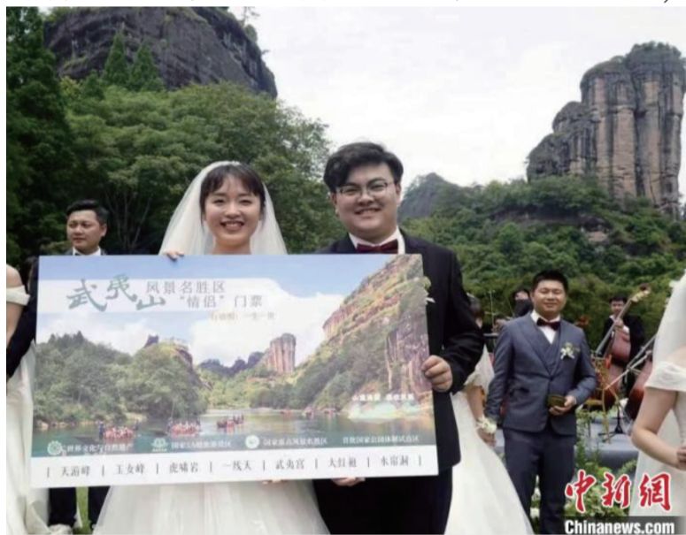
情侣获赠武夷山风景名胜区门票。

据透露，武夷山将办好“山盟海誓·恋在武夷”主题文化节，把玉女峰景点打造一个婚礼圣地，在茶博园设立一个婚拍旅拍基地，推出一批特色婚拍旅拍点、有创意有内涵的婚旅伴手礼、特色婚宴菜谱等系列产品，培训竹筏工讲好“百年修得同船渡”和爱的故事。(完)