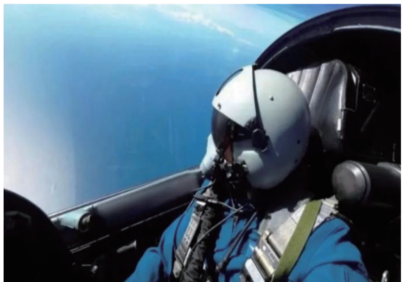
执行任务的飞行员在目视距离俯瞰祖国宝岛海岸线和中央山脉。