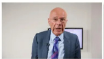
不同的全球经济秩序 for that kind of situation.